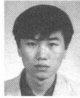
윤 준 태

[17] Yamamoto, Kaoru and Yuji Matsumoto, "Acquisition of Phrase-level Bilingual Correspondence using Dependency Structure", In Proceedings of COLING 2000, 933-939